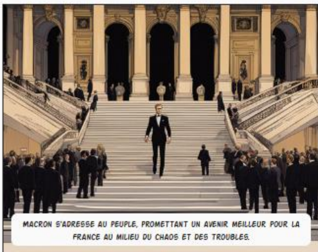
MACRON S'ADRESSE AU PEUPLE, PROMETTANT UN AVENIR MEILLEUR POUR LA FRANCE AU MILIEU DU CHAOS ET DES TROUBLES.